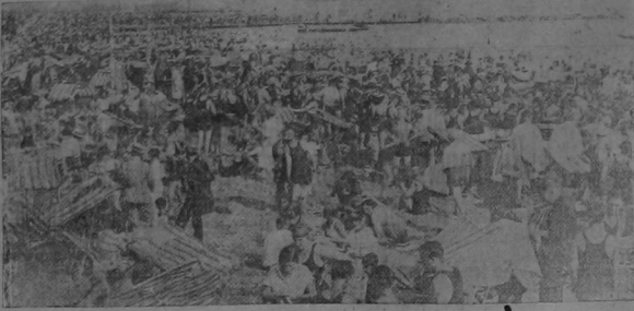
Con los calores del tórrido verano, los habitantes de la ciudad de Nueva York buscan confort y fresco en el famoso balneario de "Coney Island", y van allí en contingentes de cientos de miles, según puede apreciarse por la foto adjunta.