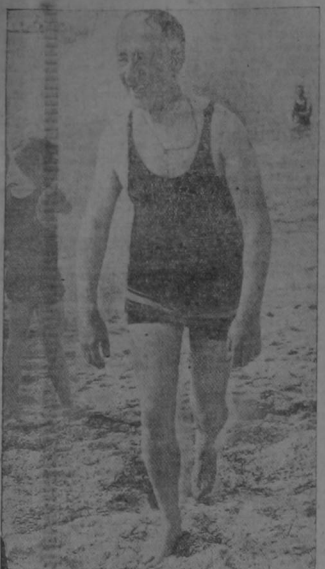
Alfredo E. Smith, Gobernador del Estado de Nueva York y candidato presidencial por el partido demócrata, disfrutando de unas vacaciones en uno de los balnearios norteamericanos, en preparación para emprender la campaña electoral.