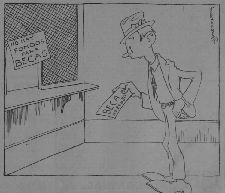
—Tiene razón don Arturo al decir que ya es muy viejo eso de tirarle al Congreso; pero eso de girar cheques sin fondos es más viejo aún... ¡y más feo!